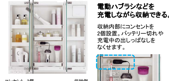
コンセント 3個 (うち収納内2個) ※写真はツインラインLED照明3面鏡 幅900mmの収納例です。