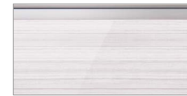
アルベロホワイト(鏡面)