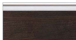
ソフトウォールナット柄