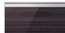
アルベロブラック(鏡面)